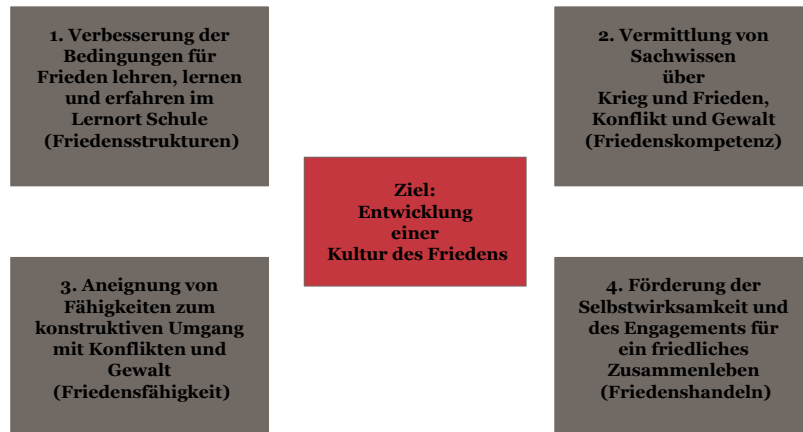
Abbildung 1: Friedensbildung an Schulen

Friedensbildung in der Schule hat dann die Aufgabe unter Einbeziehung aller beteiligten Akteure